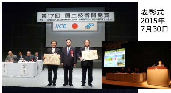
表彰式 2015年 7月30日